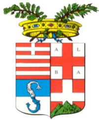
Provincia di Cuneo