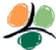
Comunità Montana Valli Mongia, Cevetta e Langa Cubana