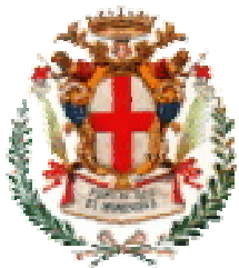
Comune di Savigliano