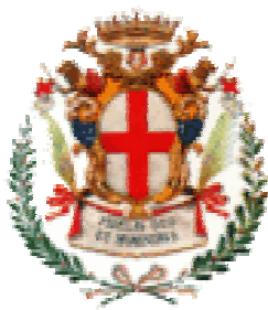
Comune di Savigliano