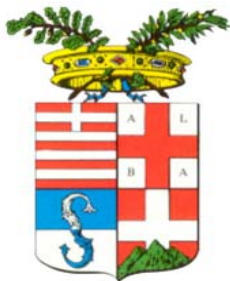
Provincia di Cuneo