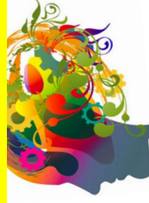
TAVOLA ROTONDA • TREND E LIMITI DELLA • COMUNICAZIONE SCIENTIFICA • DEI PRODOTTI PER LA SALUTE

22/05/2017 Ora: 9.30 - Sede Universitaria ex-convento Santa Monica Aula 017 piano terra - Via Garibaldi 6—12038 Savigliano CN